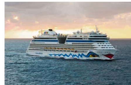
AIDAbella, AIDAdiva, AIDAluna

Alle Infos zu unseren Angeboten für Firmen finden Sie auf: aida.de > Willkommen bei AIDA > Firmenreisen