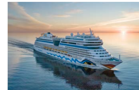
AIDAbu, AIDamar, AIDAsol, AIDAstella